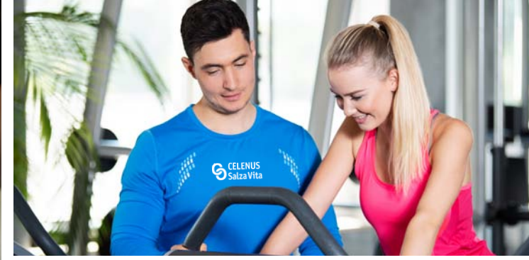
Training unter fachlicher Anleitung